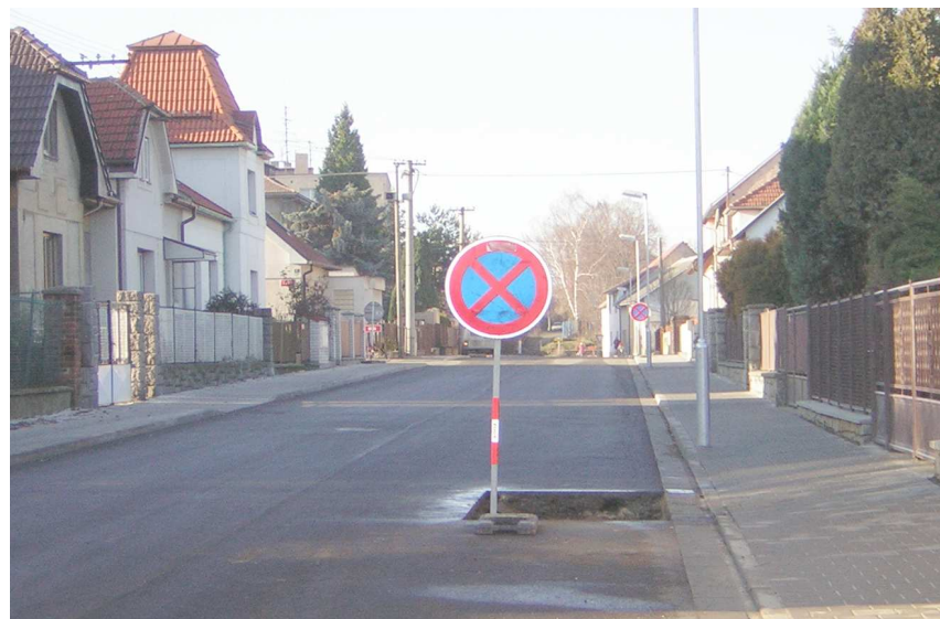
Kostelec n. Č.I., Tyršova ul. 8.12.2006, 11.30 hod.

„ Hodinky, holínky - obojí se natahuje “.